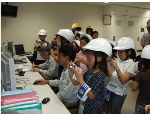
監視室のモニターを注視する「ちびっ子記者」