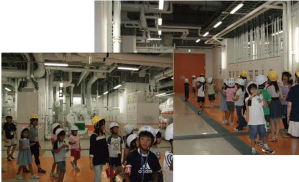
プラント内を見学する「ちびっ子記者」