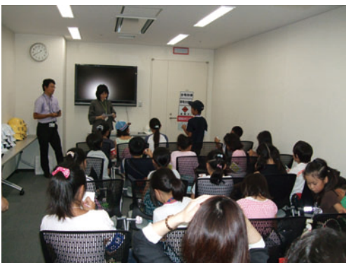
熱心に取材をする「ちびっ子記者」